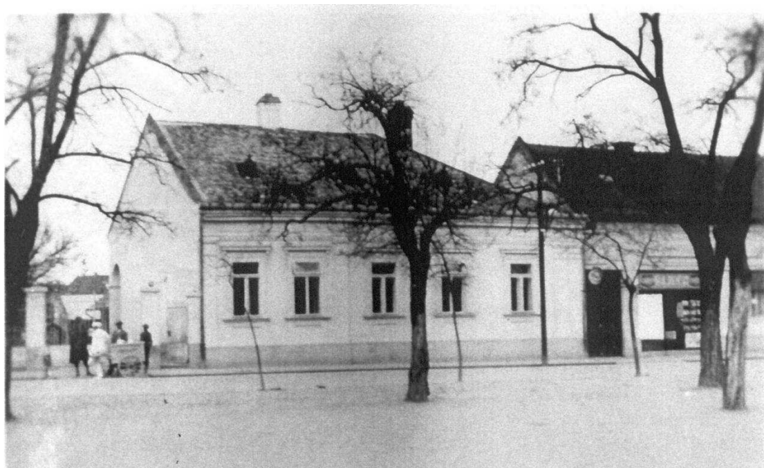
4. A szeminárium Nagybég u. 18. sz. alatti épületének homlokzati oldala