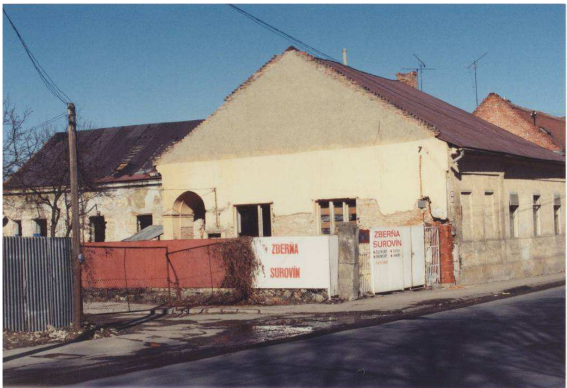
6. A Nagybég u.-i épülete a lebontás előtt