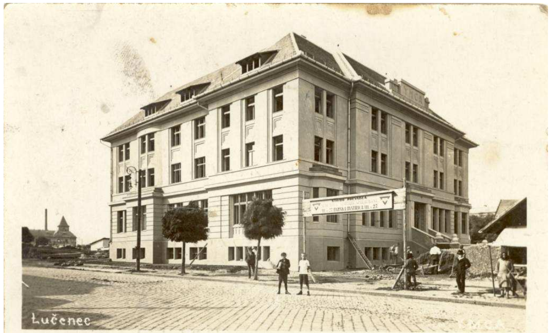
1. Az YMCA-épület, ahol 1931-ig folyt az oktatás. (1925-ös felvétel. "A falak még nem voltak szárazak.")