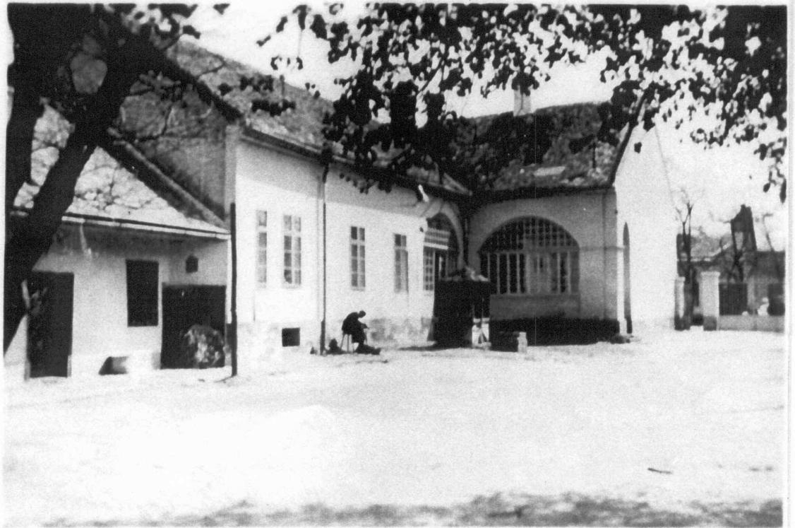
5. A szeminárium Nagybég u.-i épülete az udvar felől