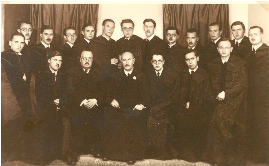
11. A szeminárium 1937-ben végzett hallgatói