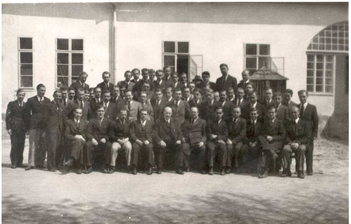
10. A szeminárium hallgatói az 1936/37-es tanévben