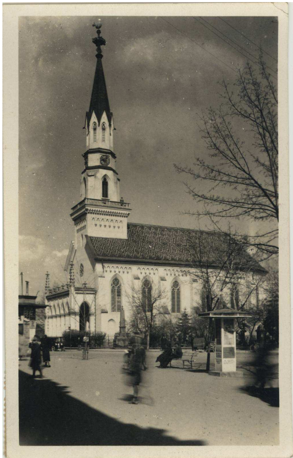
12. A losonci református templom (korabeli felvétel)