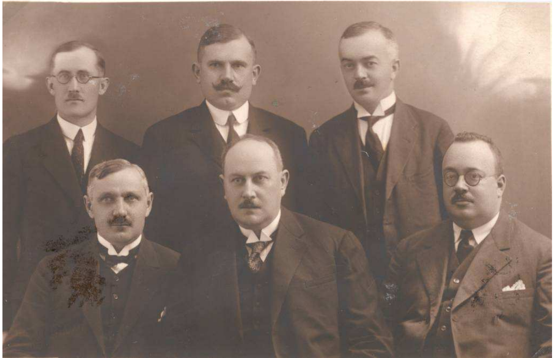
9. A szeminárium első tanárai (1925)