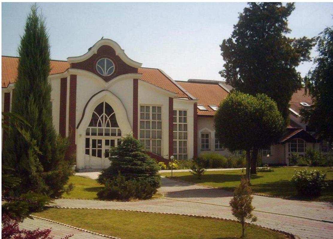
8. A szeminárium jogutódja, a komáromi Calvin János Teológiai Akadémia mai épülete