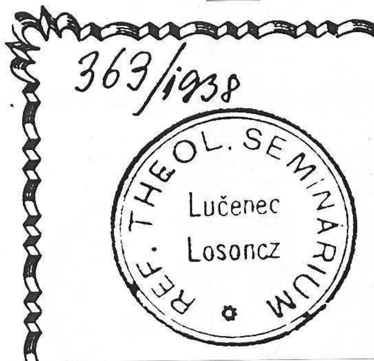
7. A szeminárium egykori pecsétje