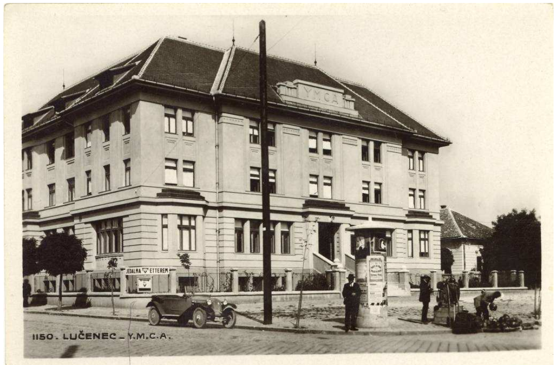
2. Az YMCA-épület, ahol 1931-ig folyt az oktatás (1930-as felvétel).